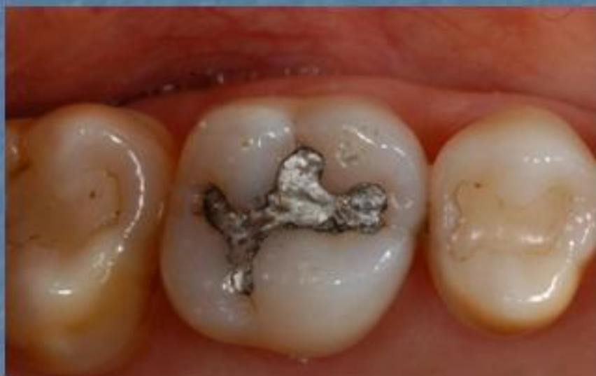
Dente 26 restaurado com amálgama