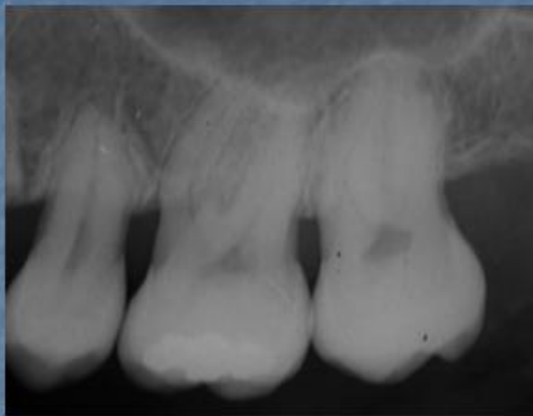
Imagem radiográfica inicial